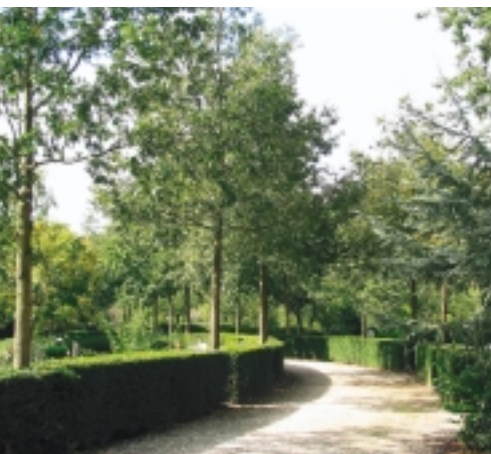
Een alternatief voor asfalt is een vriendelijker ogende halfverharding van grind of split, ofwel fijne basaltkorrels. In dit geval, op de gemeentelijke begraafplaats Zorgvlied te Amsterdam, is de keuze juist, omdat er door de opsluiting van het pad door middel van hagen geen overlast ontstaat in de grafvelden